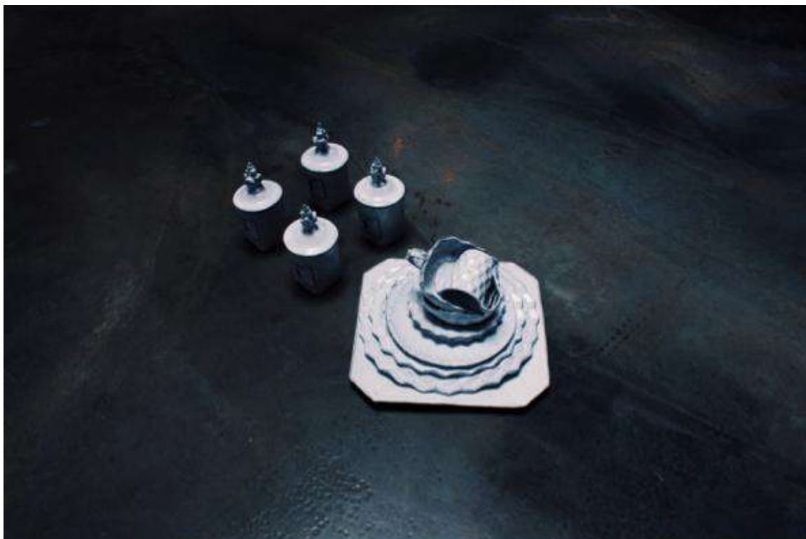
Ароматизированные свечи Astier de Villatte

Новинки от марки Astier de Villatte – сказочно красивая, романтически состаренная посуда ручной работы, в том числе блюда, вазы в виде Вифлеемской звезды. По своей форме и фактуре - это великолепные образцы для праздничной сервировки, каждый предмет может радовать глаз просто как арт-объект. Восхищение вызывает огромный белый шар, который украсит любой интерьер. Коллекция также включает эффектные столовые приборы Chiny Blak Titanium необыкновенного цвета, ароматы для дома (свечи) и одеколоны.